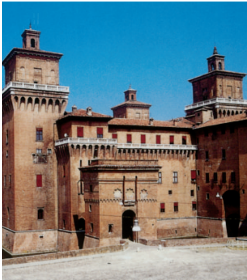
Ferrara. Il Castello Estense, voluto nel '300 dal marchese Niccolò II

mai nelle Istituzioni con cui cercò invano un continuo contatto. Si è detto che l'instabilità personale e profonda del poeta (nato a Sorrento nel 1544 ma per lungo tempo vissuto a Ferrara, alla corte degli Estensi) fu la misura dell'inquietudine di un intero periodo storico. Tasso, infatti, fu lo specchio del suo tempo, quasi che la sua difficile vicenda umana ed i suoi tormenti interiori fossero la diretta e naturale conseguenza della profonda crisi